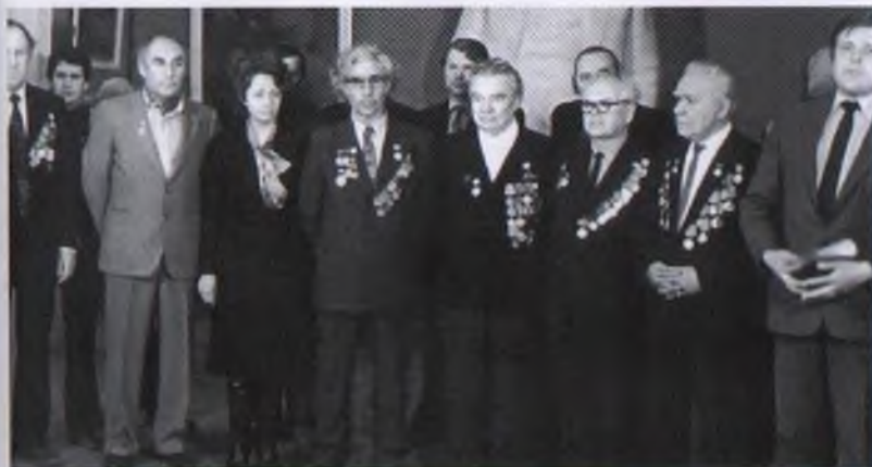
Чествование художников-ветеранов, 1985 год. Дом художника, г. Красноярск