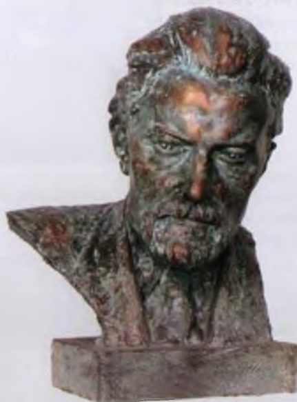
Портрет академика С.В. Лебедева, 1956 год