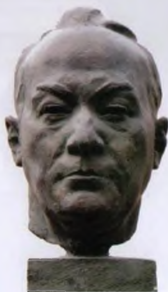
Портрет академика Л. А. Киренского, 1978 год