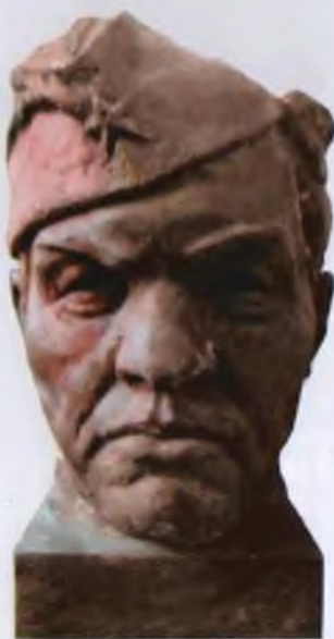
Портрет солдата, 1975 год