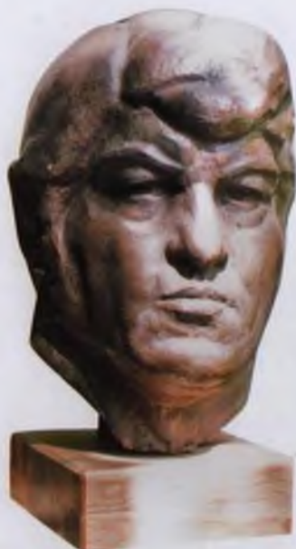
Портрет заслуженного тренера СССР Д. Г. Миндиашвили, 1982 год