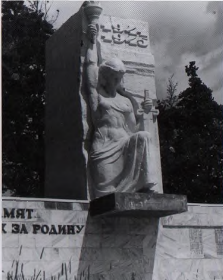
Мемориал участникам Великой Отечественной войны, 1985 год. Емельяновский район, пос. Памяти 13 борцов